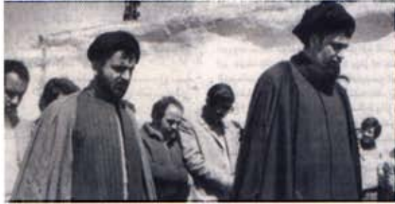
الإمام والسيد أثناء جولتهما في كفرشوبا